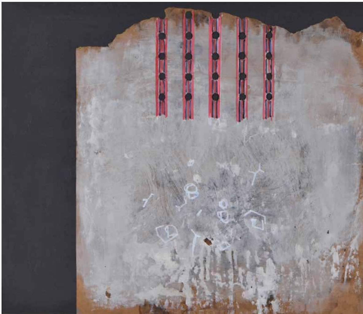
Spații variabile (2, 3) desen, acrilic și colaj pe carton, 50x70 cm, 2012